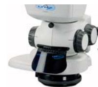
Prisma per visione obliqua/diretta