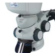
Visore ad angolo fisso