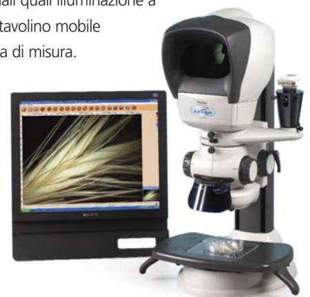
Lynx con Stativo a Colonna, con accessori per acquisizione immagine e tavolino mobile (opzionali)