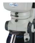
Moltiplicatore di ingrandimento