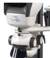
Acquisizione immagine e archiviazione